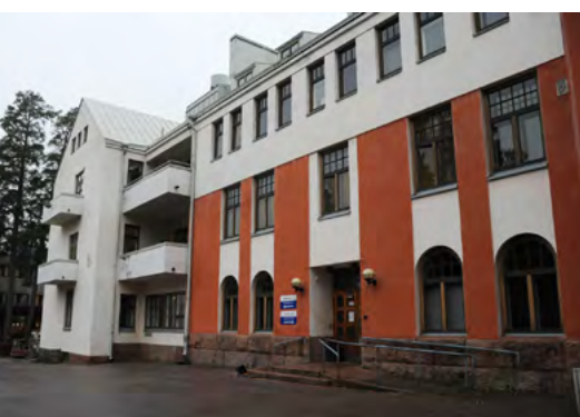
Kalliolan klinikka sijaitsee Kaunialan sairaalan tiloissa.

Kaisankodissa koulutuksen aiheena olivat vapaaehtoistyön