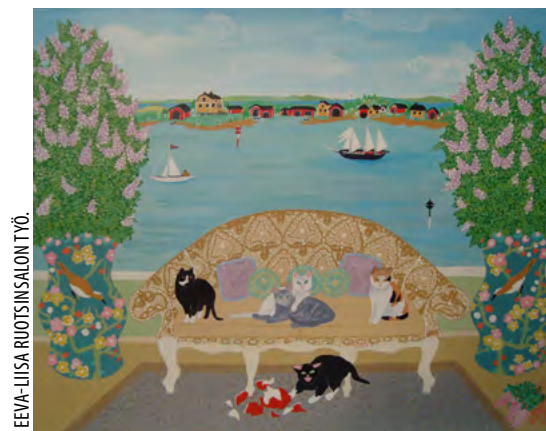
EVA-LIISA RUOTSINSALON TYÖ.

EVA-LIISA RUOTSINSALO taidemaalari Kirkkonummelta