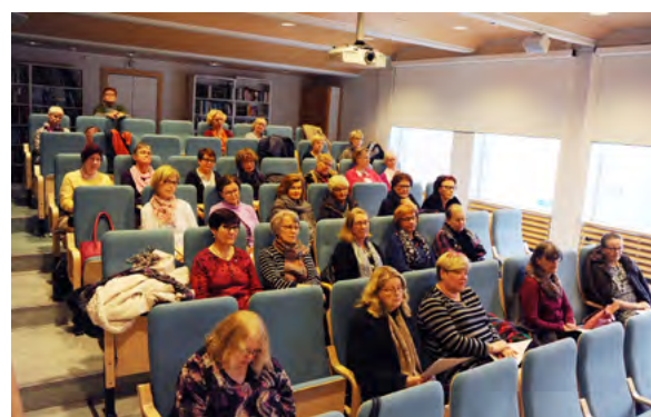
Klinikan toimintaa esiteltiin Valkonauhan jäsenistölle.