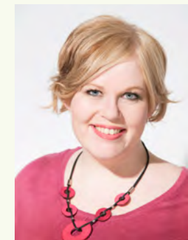
ANNIKA SAARIKKO kansanedustaja (kesk.)