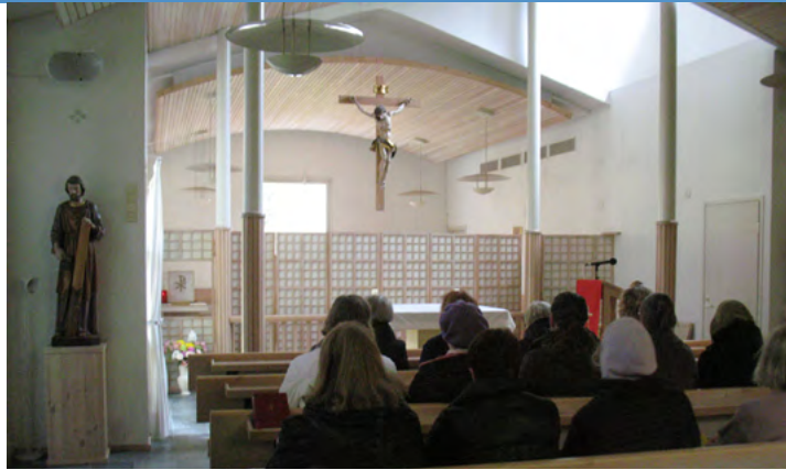
Sunnuntaina vierailimme Karmeliittaluostarissa.