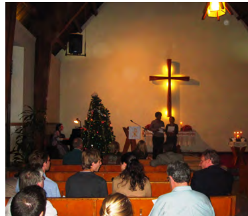
Kansainvälisen luterilaisen seurakunnan joulukirkossa oli tunnelmaa. Kuva otettu hetkeä ennen sähkökatkosta.

Kynttilät sytytettiin. Valomeri valaisi harrasta kirkkotilaa. Kaivoimme kassista otsalampun. Ja me suomalaiset jatkoimme: ”Tulkaa kaikki nyt laulamaan on poika syntynyt maailmaan! Tulkaa laulamaan, aa, aa, aaa!”