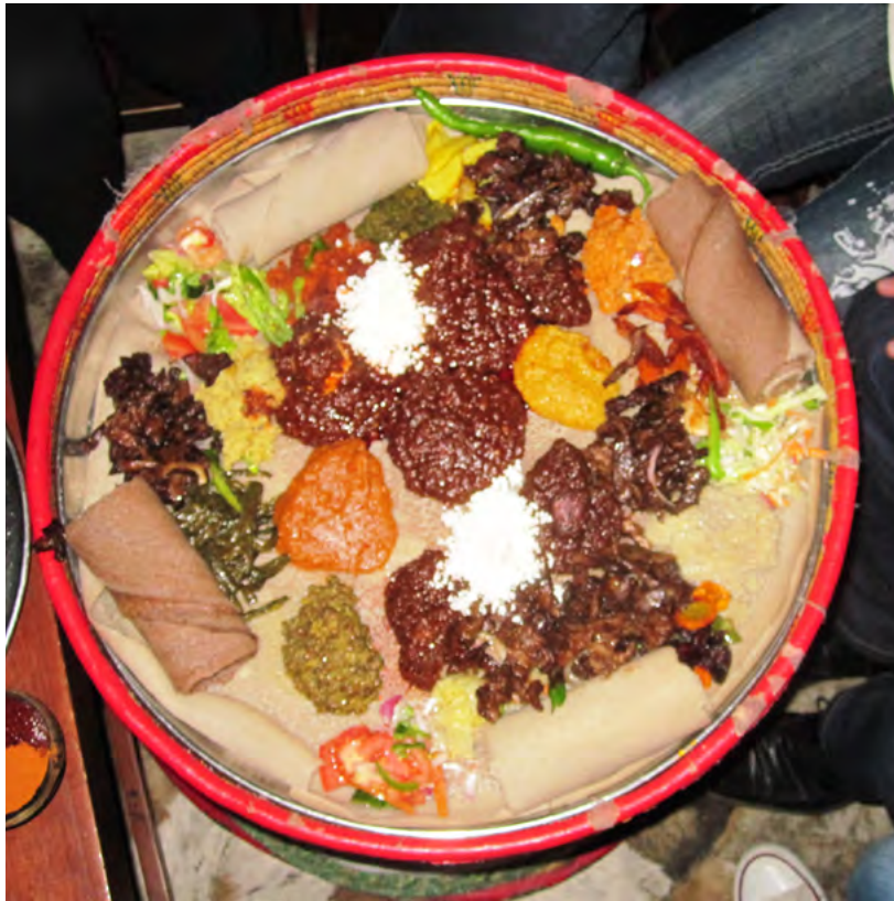
Etiopialaiset syövät injeraa joka päivä, myös jouluna. Kuvassa juhlaateria; injeralättyjä monella erilaisella herkullisella kastikkeella höystettynä.

Etiopiassa noudatetaan Juliaannista kalenteria. Siellä on meillä tänä vuonna 2009. Vuosi vaihtuu syyskuussa, ja vuodessa on kolmetoista kuukautta.