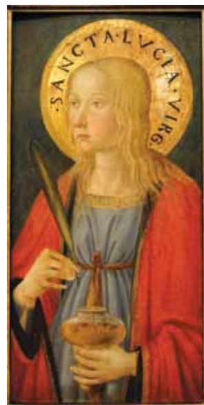
SAINT LUCY / COSIMO ROSSELLI, FLORENCE, 1470

Lucia oli vuonna 283 syntynyt sisilialainen ylhäisöperheen nuori tytär Syrakusasta. Jäätyään orvoksi isänsä kuoleman jälkeen hän eli äitinsä kanssa ja oli kihlattu jo varhain vanhempiensa valitsemalle miehelle. Lucian äiti sairastui punatautiin ja niin-pä äitiään rakastava ty-