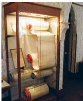
Vas. Polyglot Roomissa säilytetään vetoomuskääröjä, joissa on 7.5 miljoonaa nimeä, joukossa myös suomalaisia.