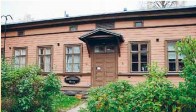
Kokouspaikkamme oli kodikas Huoneistohotelli Marja.

Alustuksen jälkeen siirryimme perinteikkäälle Mikkelin upseerikerholle ja valmistauduimme Mikkelin Valkonauhan 110-vuotisjuhlaan. Mikkelin Upseerikerho toimii Mikkelin vanhalla kasarmialueella, Suomen vanhaa väkeä varten rakennetulla Tarkk'ampujakasarmilla. Upseerikerholla on koettu ja tehty suomalaisen sotilasperinteen historiaa 1880-luvulta lähtien. Sodan aikana kerho palveli va-