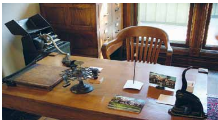
Tämän työpöydän ääressä syntyivät ne monet oivallukset, jotka ovat kantaneet valkonauhatyötä tähän päivään.

ta. Hänen kuoltuaan toiset jäsenet jatkoivat työtä. Frances Willard on muotoillut vetoomuksen hyvin kauniisti, runollisen juhlavasti. Se on pitkä vetoomus säilyttää maailma raittina, vapaana kaikista päihteistä – suojella perheitä niiden aiheuttamilta ahdistuksilta. Näin vetoomus alkaa: ”Me, jotka olemme al-