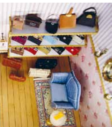
tuo mieleen lämpimiä muistoja