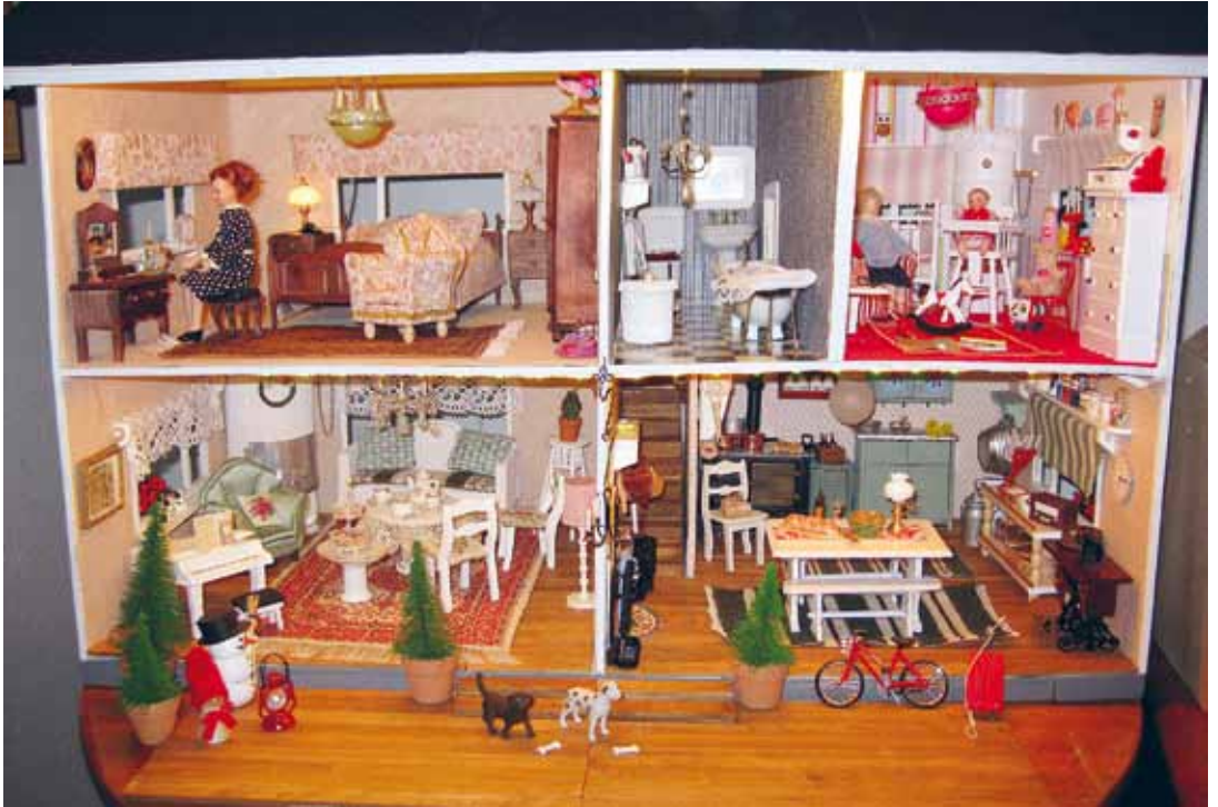
Tämä nukkekoti on täydellinen kaikkine varusteineen ja toimintoineen. Yläkerran lastenhuoneesta on suurempi kuva tämän lehden sivuilla 36 ja 40.

dollaria. Talon sisustusta päivitetään aina kulloisen isäntävään tyylin mukaiseksi. Miltähän siellä nyt Trumpin maun mukaan näyttää!