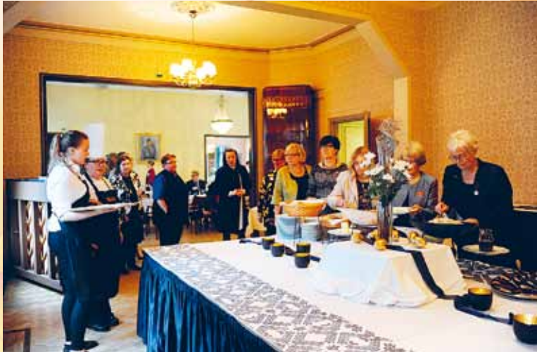
Kiitos kokille ja koko henkilökunnalle hyvästä juhla-ateriasta.