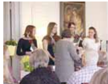
Konsertin esiintyjä kuitettavana.