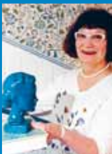
LIISA MÄNTYMIES kirjailija ja toimittaja