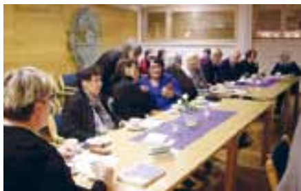
Oulun Valkonauhan jäseniä Suomi 100 vuotta -juhlassa.